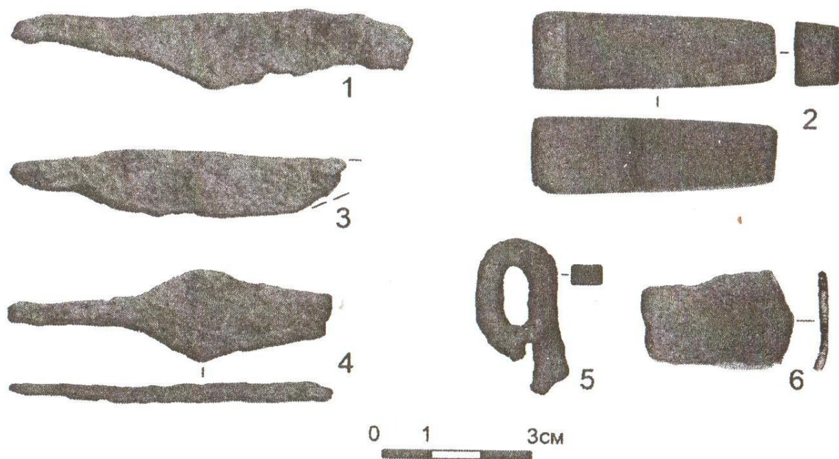
Рис. 2. Находки из раскопов на селище: 2, 3, 4 – раскоп №1; 1, 6 – №2; 5 – №3

Итак, исследования 2008 г. на селище, примыкающем к Малышевскому городищу, позволили установить синхронность этих памятников. Практическое отсутствие среди керамики раннегончарных фрагментов, украшенных линейно-волнистым орнаментом, свидетельствует, что данное поселение никак не могло существовать позднее X в. Иначе говоря, оно не пережило городище, время функционирования которого укладывается во вторую половину X в. Что же касается времени появления селища, то оно, очевидно, возникло одновременно с городищем. Отсутствие культурного слоя под валом